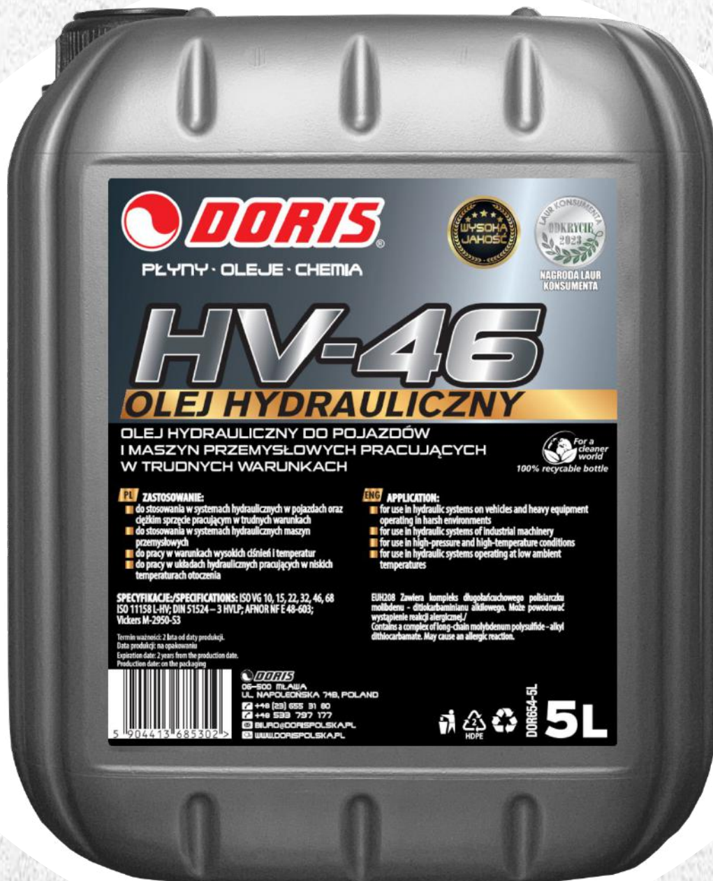
Hydraulic oil HV-46 5L KWR