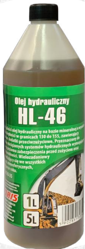
Hydraulic oil HL-46 1L