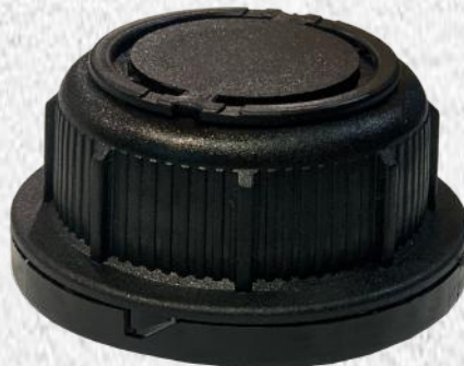
Hydraulic oil HL-46 5L KWR-ZLK