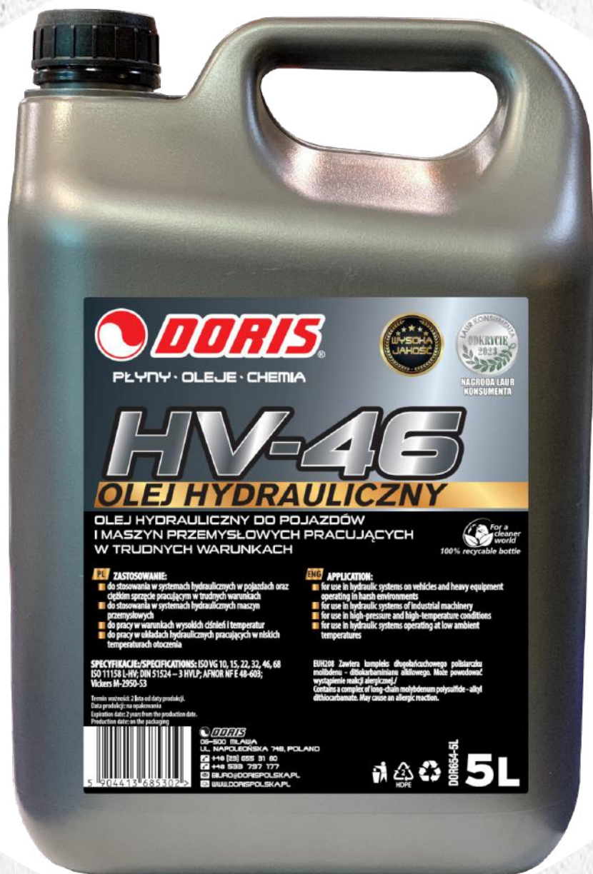
Hydraulic oil HV-46 5L STD