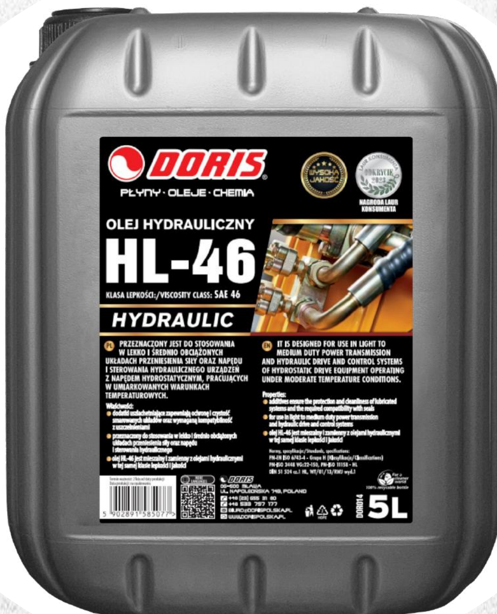
Hydraulic oil HL-46 5L KWR