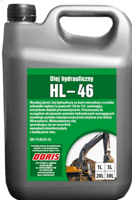
Hydraulic oil HL-46 5L STD