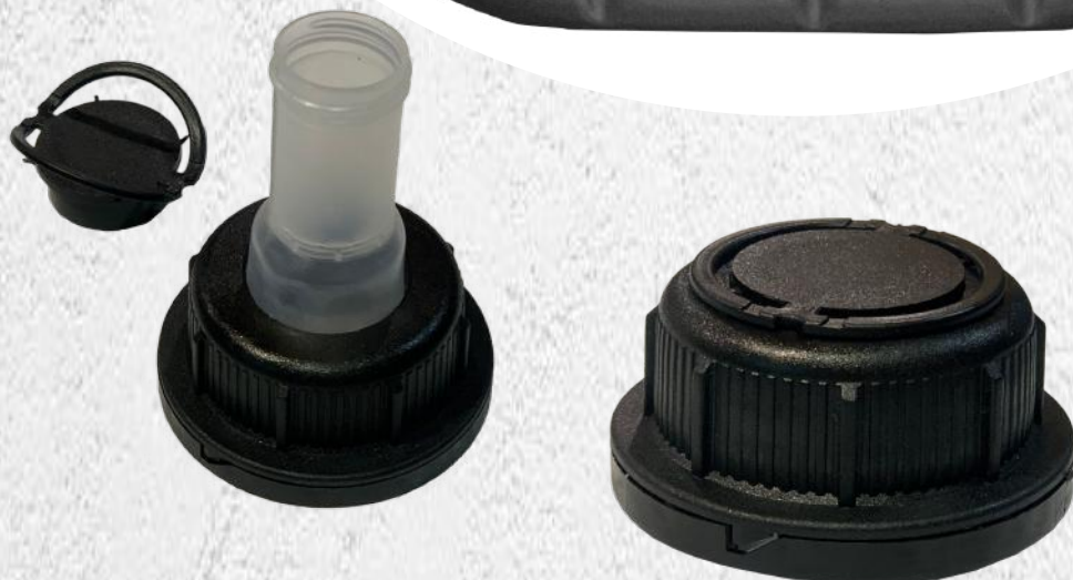
Hydraulic oil HV-46 5L KWR-ZLK