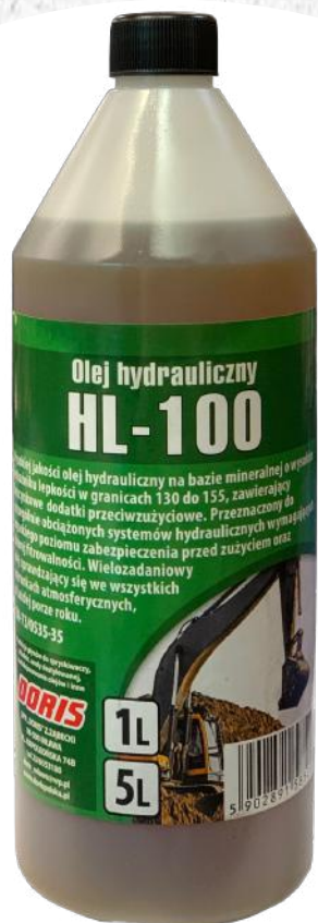
Hydraulic oil HL-100 1L