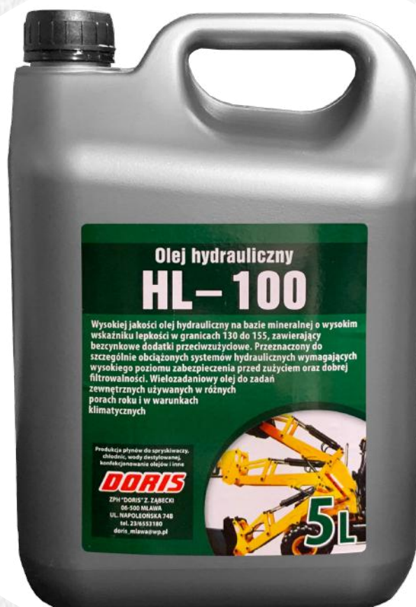
Hydraulic oil HL-100 5L STD