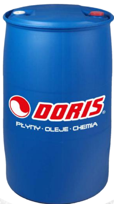
Products in plastic barrels