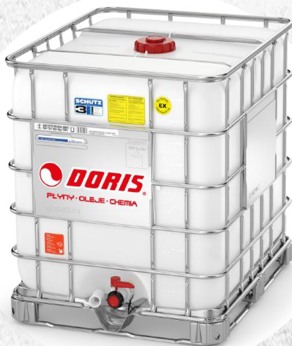
Products in IBC containers