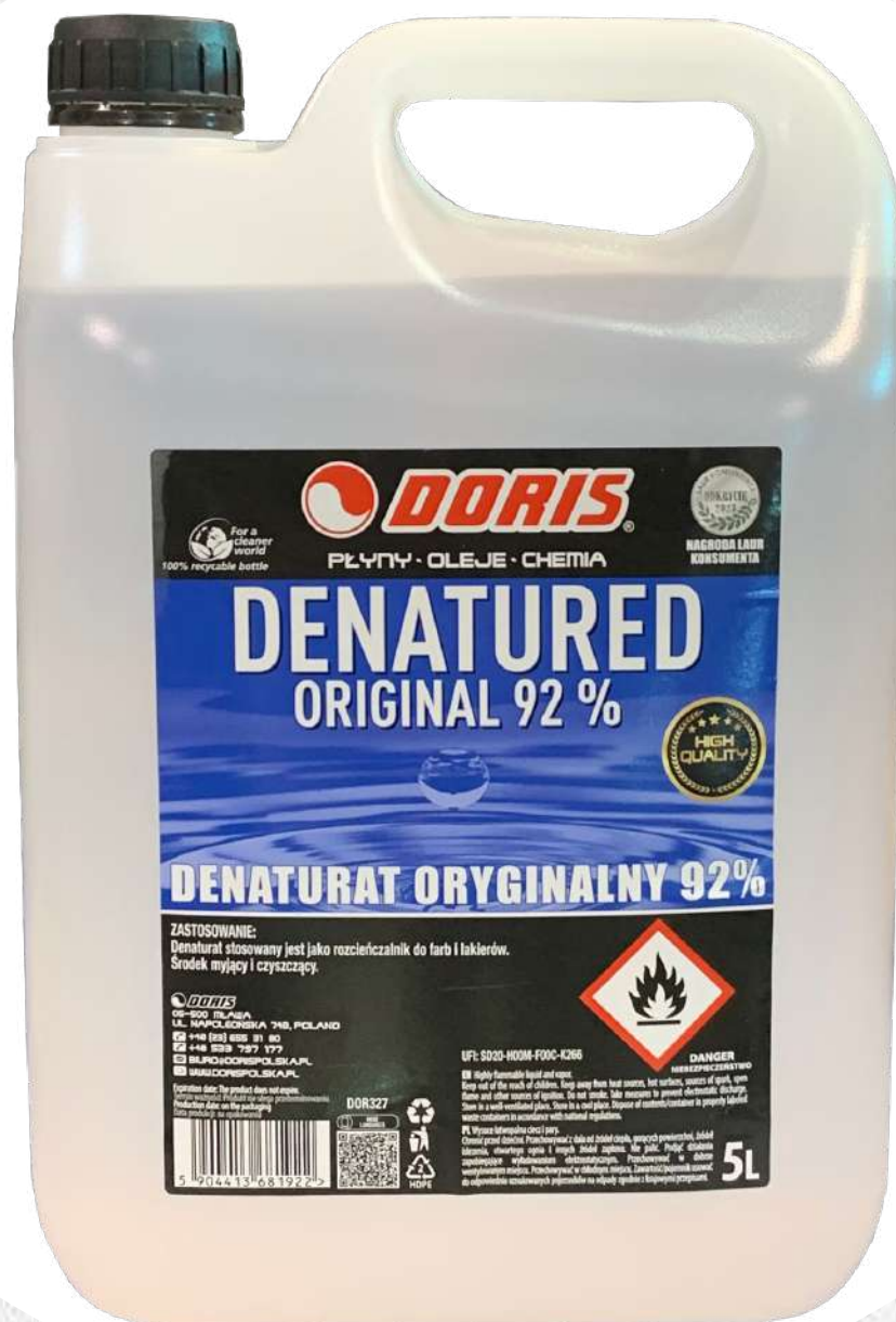
Doris Denaturat 5L bezbarwny 92% oryginalny STD