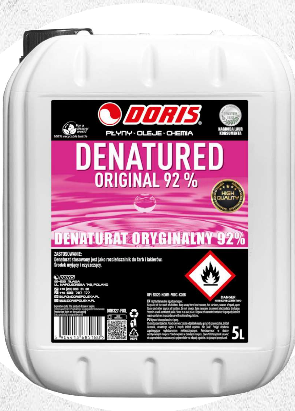
Doris Denaturat 5L fioletowy 92% oryginalny KWR