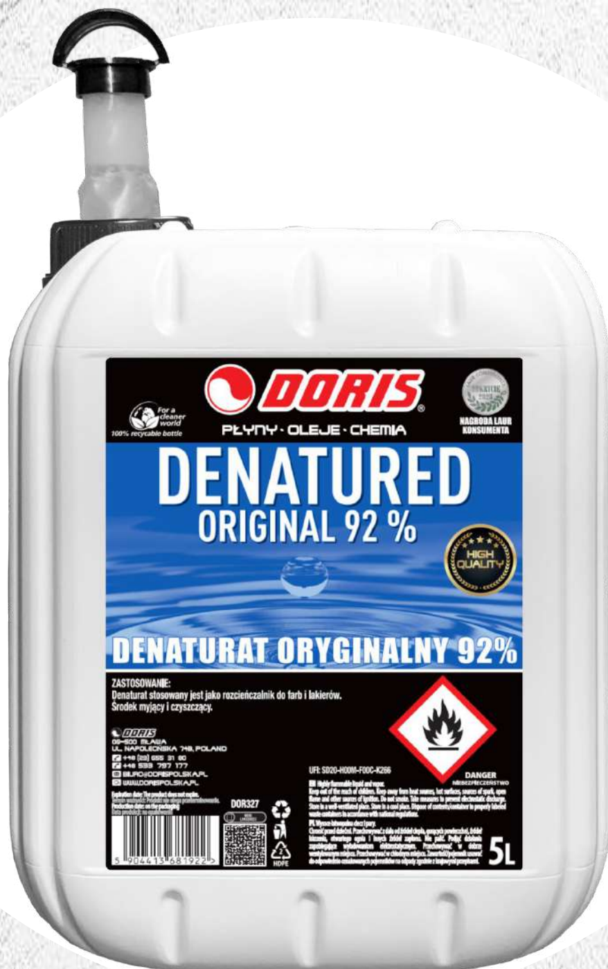
Doris Denaturat 5L bezbarwny 92% oryginalny KWR-ZLK