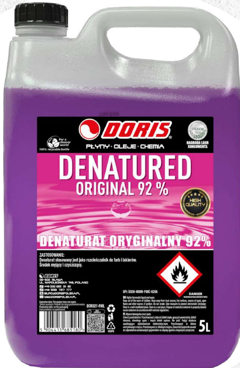
Doris Denaturat 5L fioletowy 92% oryginalny STD