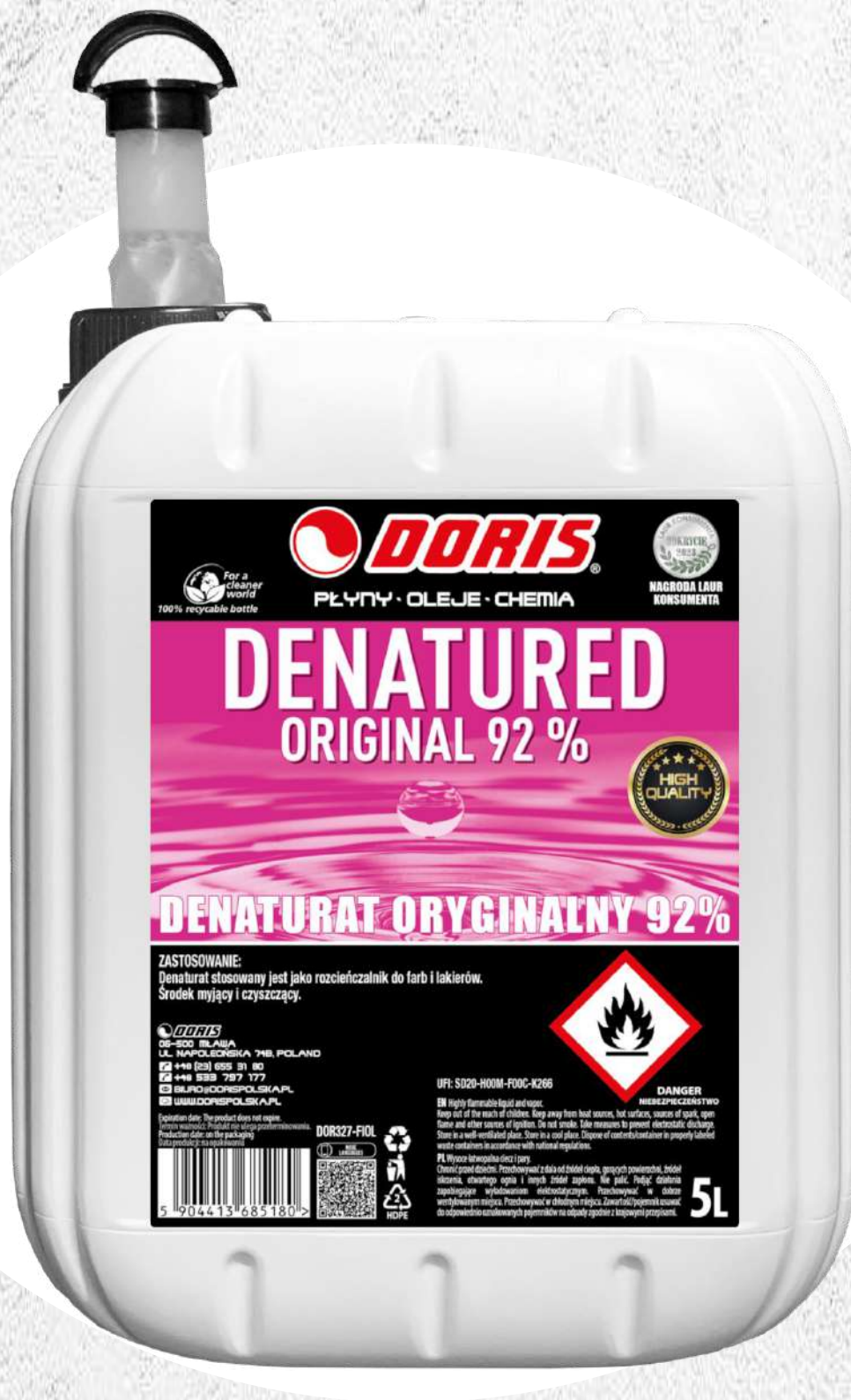
Doris Denaturat 5L fioletowy 92% oryginalny KWR-ZLK