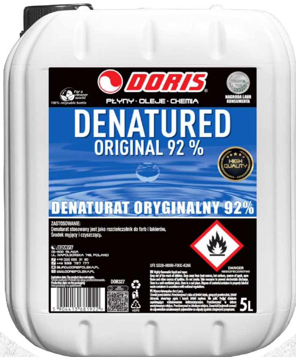
Doris Denaturat 5L bezbarwny 92% oryginalny KWR