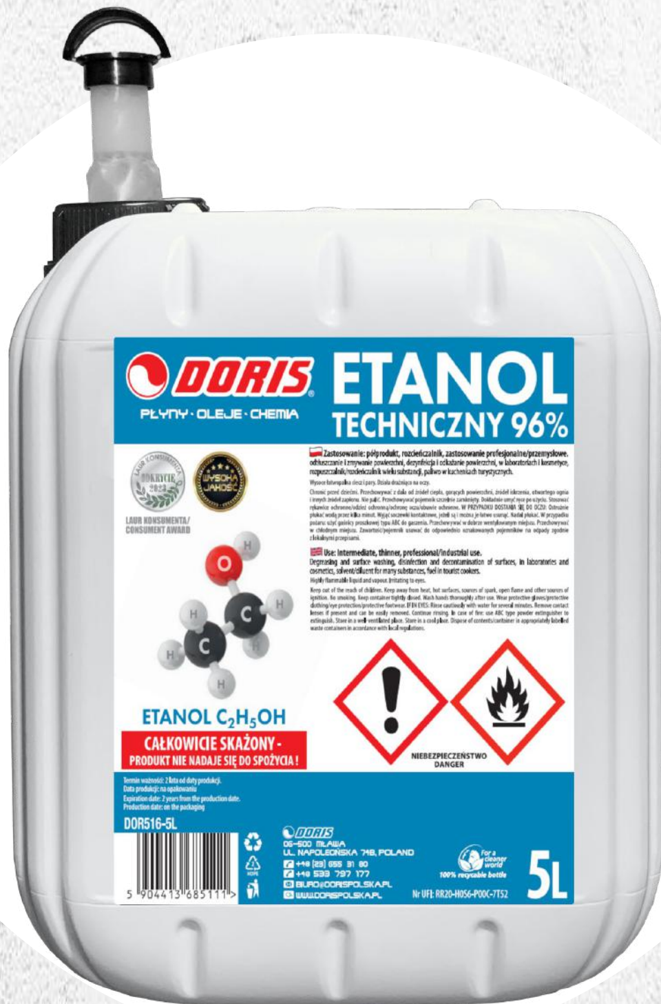
Etanol techniczny 5L KWR-UN-ZLK