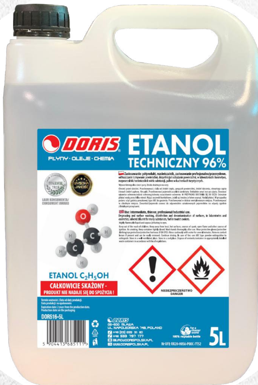
Etanol techniczny 5L STD-UN