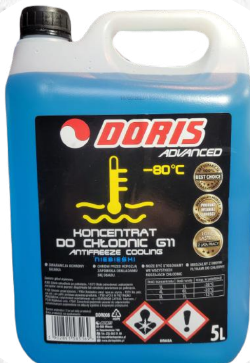
Koncentrat chłodniczy niebieski G11 -80°C (5L) STD