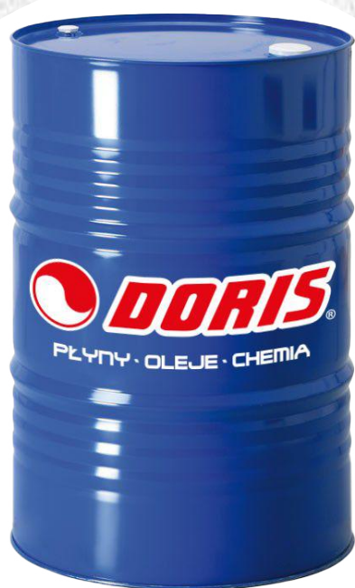
Produkty w beczkach metalowych