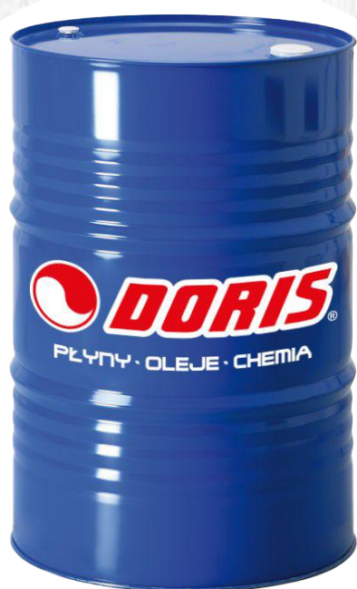
Produkty w beczkach metalowych