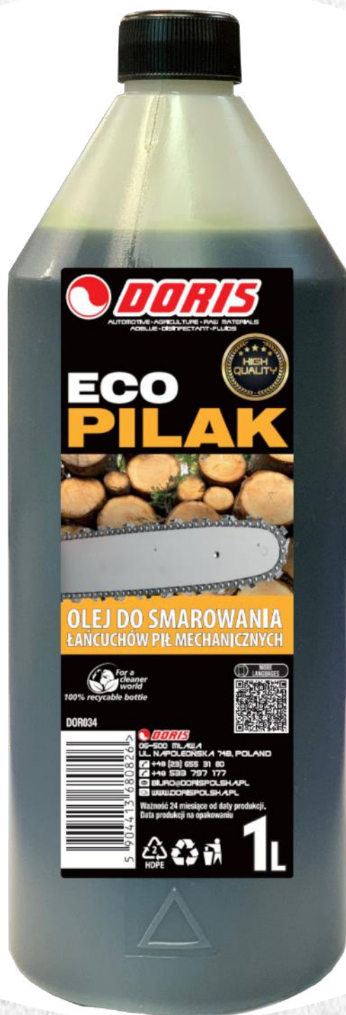
Olej do smarowania łańcucha pił PILAK 1L