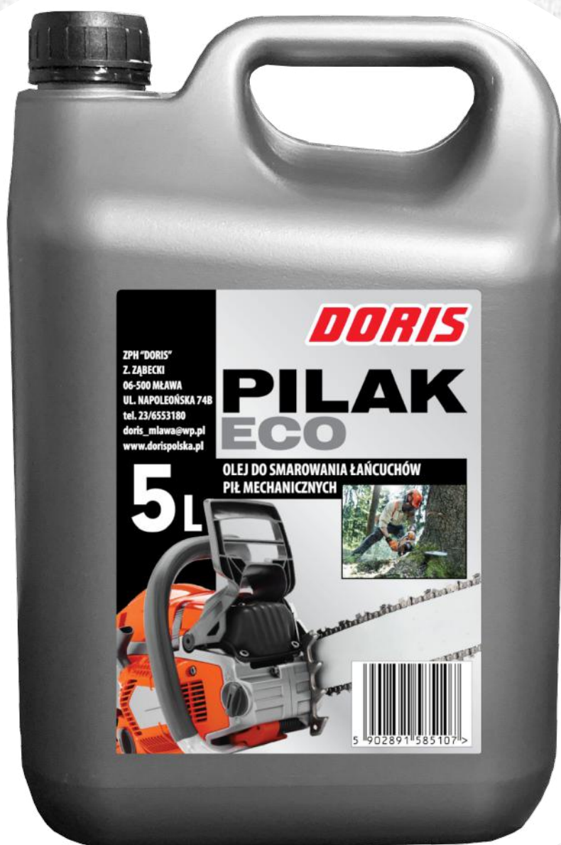
Olej do smarowania łańcucha pił PILAK 5L STD