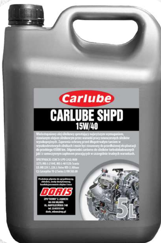
Olej silnikowy SHPD 5L STD