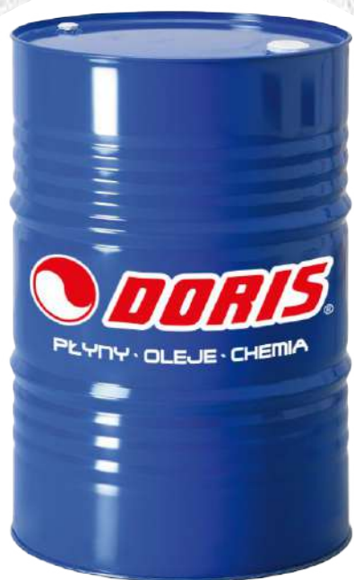
Produkty w beczkach metalowych