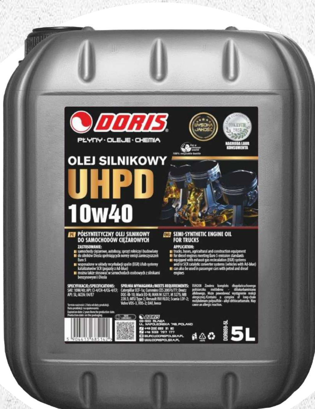
Olej silnikowy UHPD 5L KWR