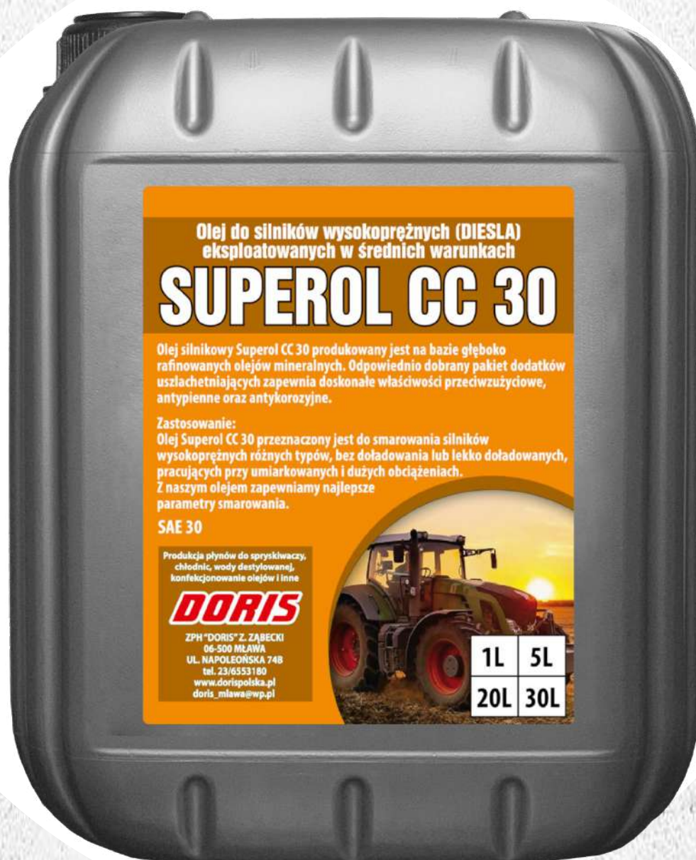
Olej silnikowy Superol CC-30 5L KWR