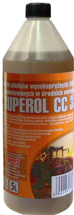
Olej silnikowy Superol CC-30 1L