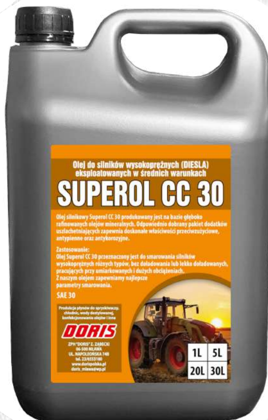
Olej silnikowy Superol CC-30 5L STD