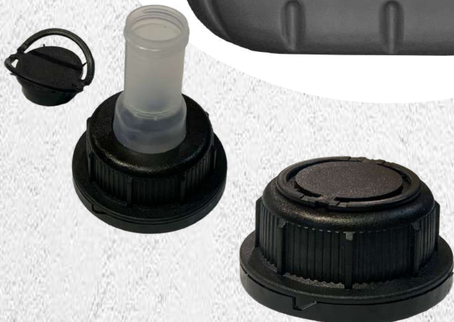
Olej silnikowy UHPD 5L KWR-ZLK