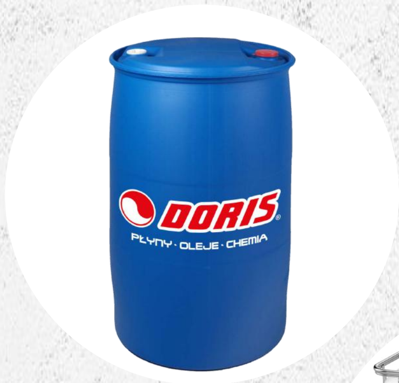
Produkty w beczkach plastikowych