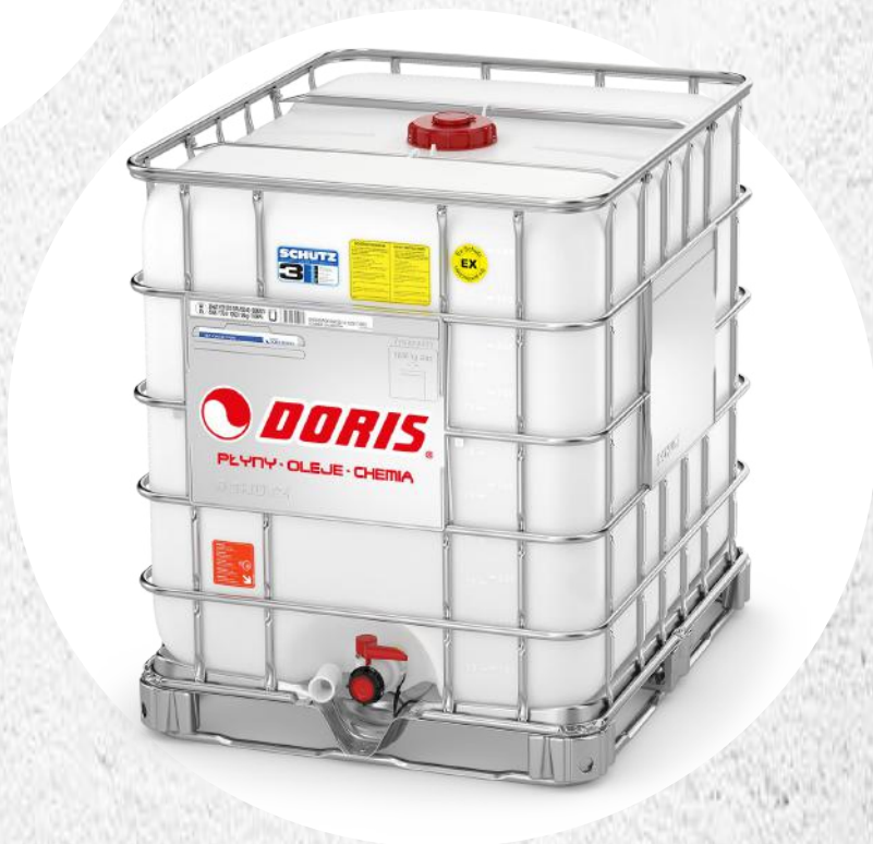
Produkty w kontenerach IBC