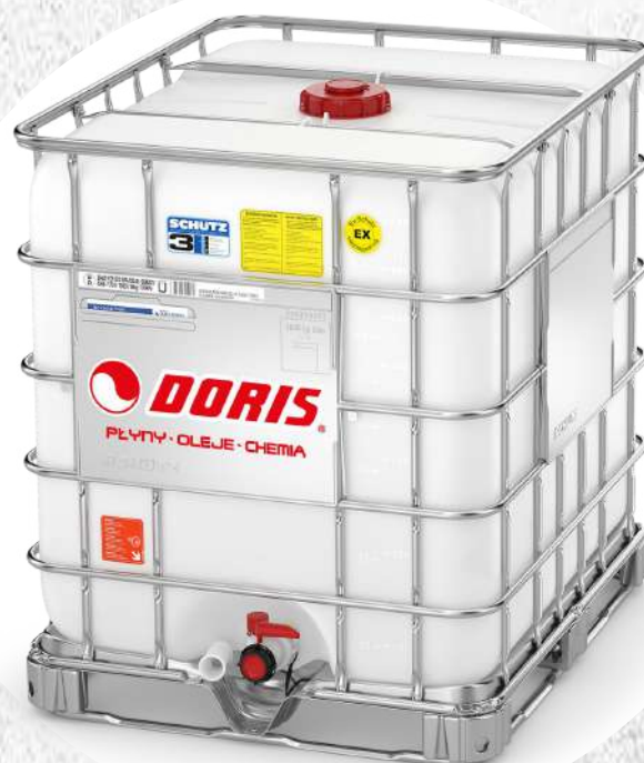
Produkty w kontenerach IBC