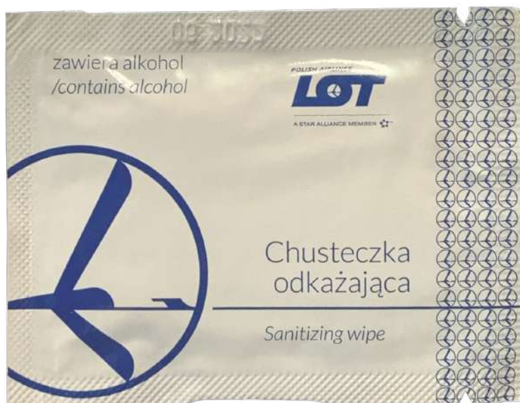
Chusteczka do dezynfekcji klienta