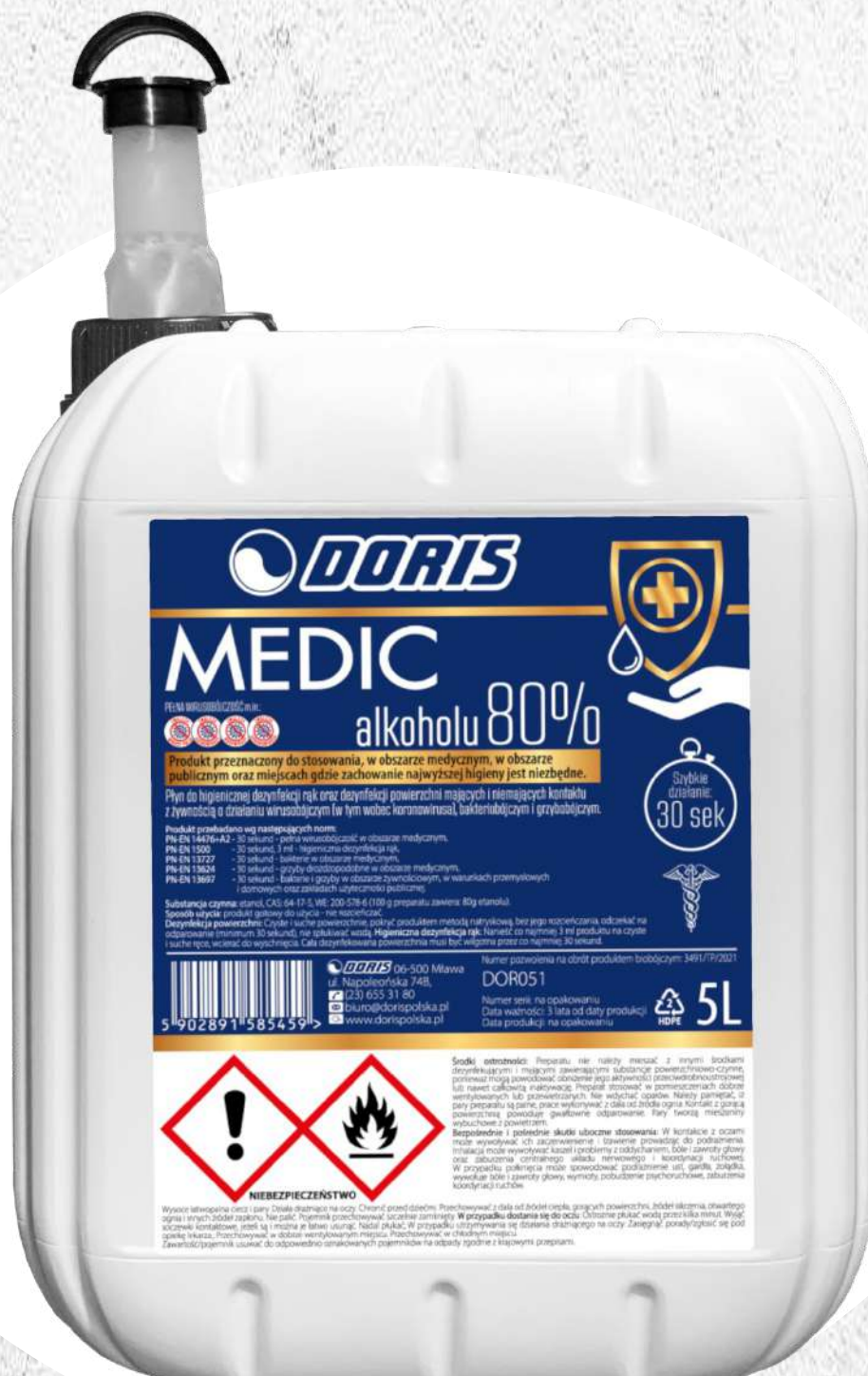
Doris Medic medyczny płyn do dezynfekcji do rąk i powierzchni 80% alkoholu 5L kanister KWR-ZLK