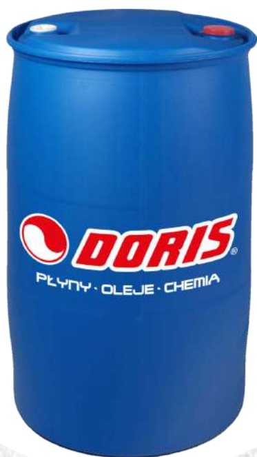
Produkty w beczkach plastikowych