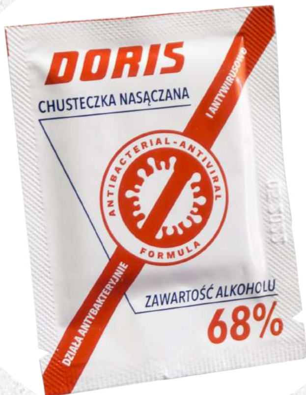
Chusteczka do dezynfekcji Doris