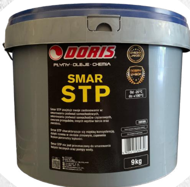
Smar STP 9kg