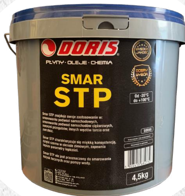
Smar STP 4,5kg