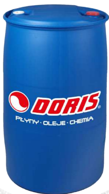
Produkty w beczkach plastikowych