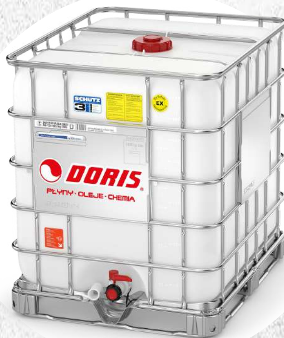
Produkty w kontenerach IBC