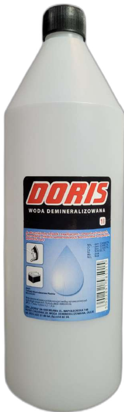
Woda demineralizowana 1L STD